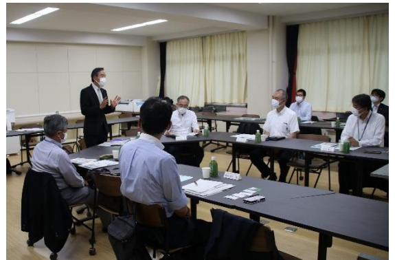
マイスター・ハイスクール事業 第1回推進委員会