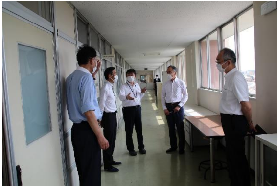
授業（実習系科目）視察