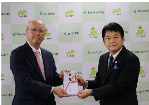
当社社長 清水市長

当社は、今後も埼玉県内の企業として地域とともに歩み、持続可能な地域社会の実現に向けた課題の解決や地域社会の発展に寄与する活動に取り組んでまいります。