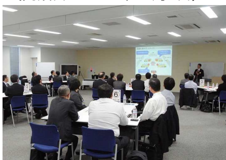
「埼玉BCM訓練センター」の訓練会場

AGSグループのAGSシステムアドバイザー株式会社は「埼玉BCM訓練センター」を開設しました。 （開設日：2014年10月1日）